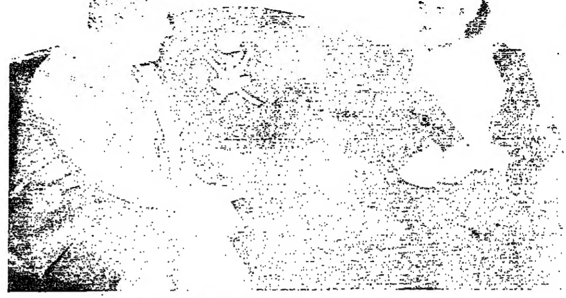
جلالة السلطان قابوس المعظم لدى استقباله لسيادة نائب الرئيس المصري

الكويت - قرناً - كلف مجلس الوزراء الكويتي لجنة خاصة من الوزارات المعنية لدراسة اقتراح جلالته السلطان قابوس بن سعيد المعظم بتعاون دول الخليج للحفاظ على الحيوانات والنباتات البرية بشبه الجزيرة العربية.